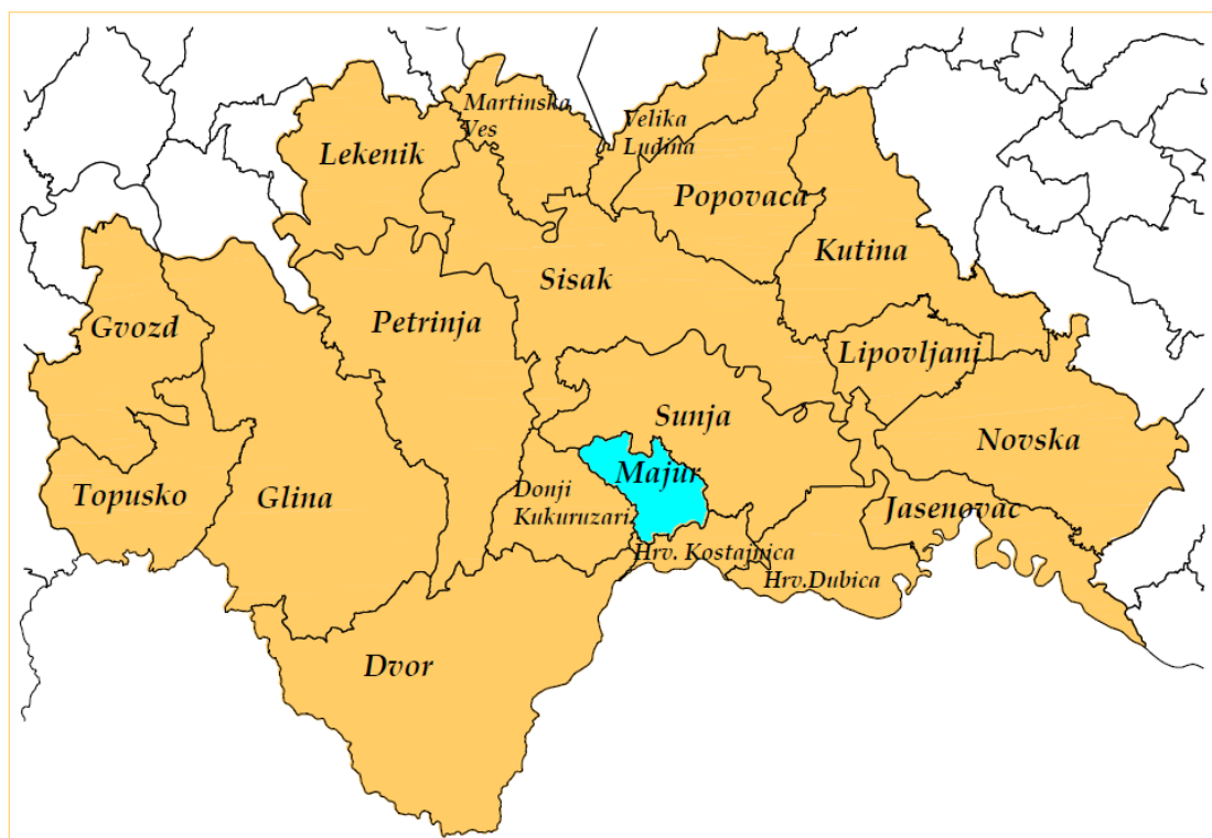
Slika 1. Položaj Općine Majur u Sisačko-moslavačkoj županiji

Prema podacima Državne geodetske uprave iz 2013. godine općina Majur zauzima površinu od 67,96 km 2 , što predstavlja 1,52% površine Sisačko-moslavačke županije i po čemu je druga najmanja jedinica lokalne samouprave u županiji.