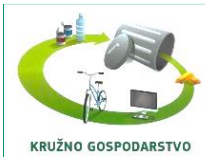
Slika 4: Kružno gospodarstvo

Jedan od osnovnih ciljeva Europske Unije je potaknuti unaprjeđenje gospodarskog sustava u smislu učinkovitijeg korištenja resursa i energije. Središnji aspekt ove strategije je prelazak s postojećeg, linearnog, na kružno gospodarstvo, ekonomski model koji osigurava održivo gospodarenje resursima i produžavanje životnog vijeka materijala i proizvoda. Cilj ovog modela je svesti nastajanje otpada na najmanju moguću mjeru, i to ne samo otpada koji nastaje u proizvodnim procesima, već sustavno, tijekom čitavog životnog ciklusa proizvoda i njegovih komponenti.