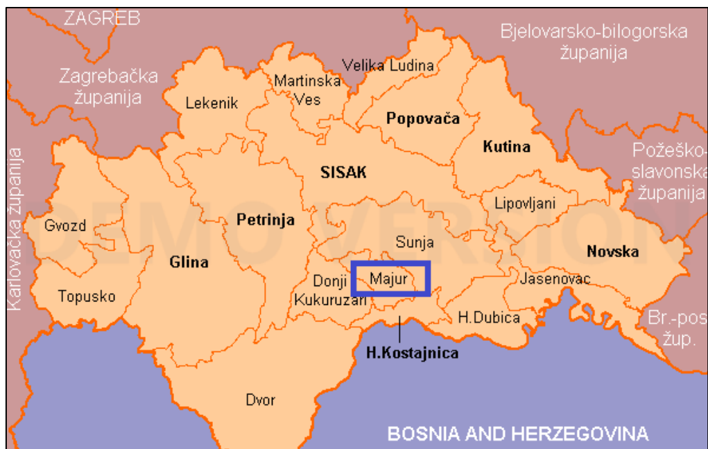
Slika 1: Administrativne granice Općine Majur unutar Sisačko-moslavačke županije (Izvor: www.mup.hr )

Općina Majur obuhvaća 11 naselja: Gornja Meminska, Gornji Hrastovac, Graboštani, Kostrići, Majur, Malo Krčevo, Mračaj, Srednja Meminska, Stubalj, Svinica i Veliko Krčevo, a prema posljednjem popisu stanovništva iz 2011.godine na području općine Majur je živjelo 1.185 stanovnika u 480 kućanstava.