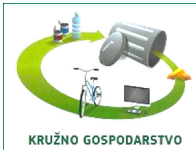
Slika 4: Kružno gospodarstvo

Jedan od osnovnih ciljeva Europske Unije je potaknuti unaprjeđenje gospodarskog sustava u smislu učinkovitijeg korištenja resursa i energije. Središnji aspekt ove strategije je prelazak s postojećeg, linearnog, na kružno gospodarstvo, ekonomski model koji osigurava održivo gospodarenje resursima i produžavanje životnog vijeka materijala i proizvoda. Cilj ovog modela je svesti nastajanje otpada na najmanju moguću mjeru, i to ne samo otpada koji nastaje u proizvodnim procesima, već sustavno, tijekom čitavog životnog ciklusa proizvoda i njegovih komponenti.