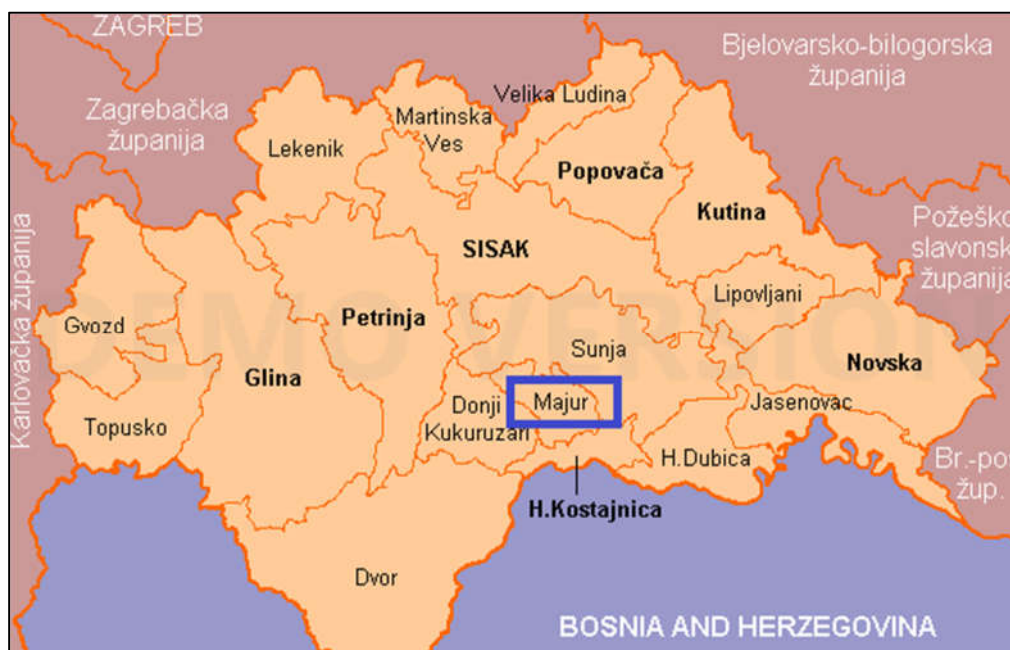
Slika 1: Administrativne granice Općine Majur unutar Sisačko-moslavačke županije (Izvor: www.mup.hr )

Kraj je tradicionalno poljoprivredno-stočarski. Šumsko bogatstvo važna je osnova za ponovno pokretanje industrije prerade drva. Gospodarska osnova su poljodjelstvo, stočarstvo i obrada drva. Teritorijem prolazi državna cesta Vedro Polje – Hrvatska Kostajnica i željeznička pruga Sisak – Sunja – Volinja – granica BiH. Blizina i dobra prometna povezanost s gradovima Siskom i Petrinjom, te buduća izgradnja autoceste Velika Gorica – Sisak, čista priroda, blago razvedeni brežuljci, šumsko bogatstvo, a nadasve čestiti i marljivi žitelji jamstvo su boljeg života u Općini Majur. (izvor: www.opcina-majur.hr )